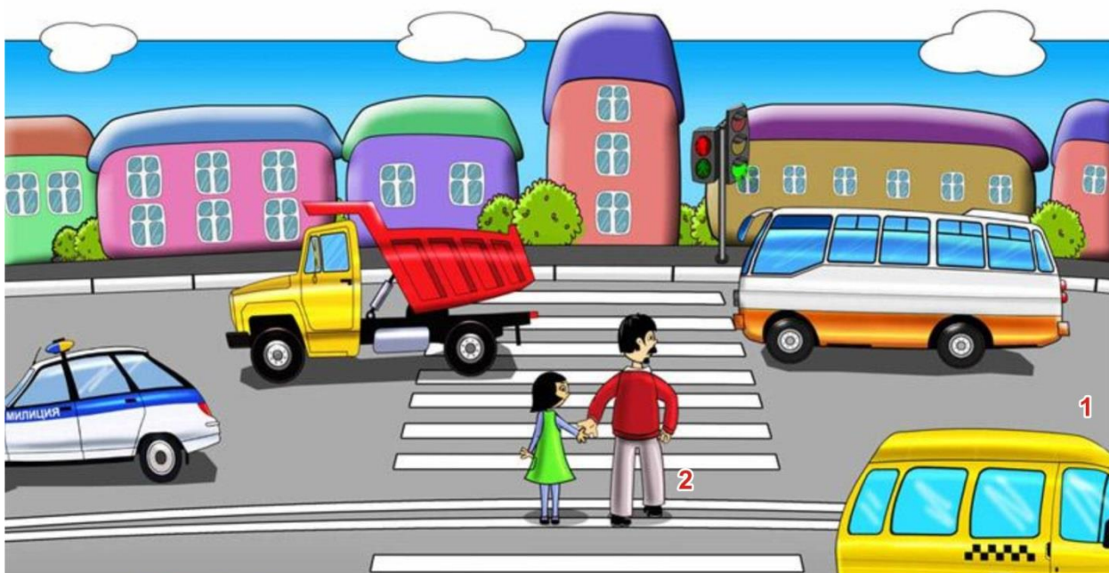
Участники дорожного движения: 1 - водители 2 - пешеходы

Выйдя из подъезда своего дома, ты становишься пешеходом и имеешь цель движения и место, куда направляешься. Помимо цели, каждый выбирает для пешеходного движения свой маршрут. Мы стараемся, чтобы маршрут движения был как можно более удобным и безопасным. Маршрут – это путь нашего движения к цели.